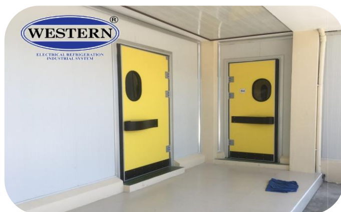
NHA TRANG Seafood: 2008-2010-2013-2015-2018-2022 \