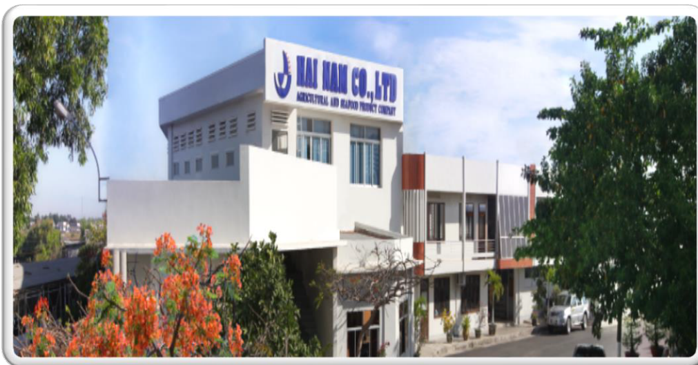
HẢI NAM Seafood