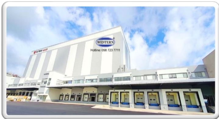
Kho lạnh AJ TOTAL Long An 54m