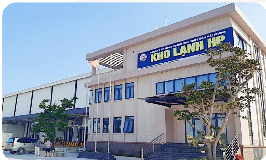
HẢI PHÒNG Seafood