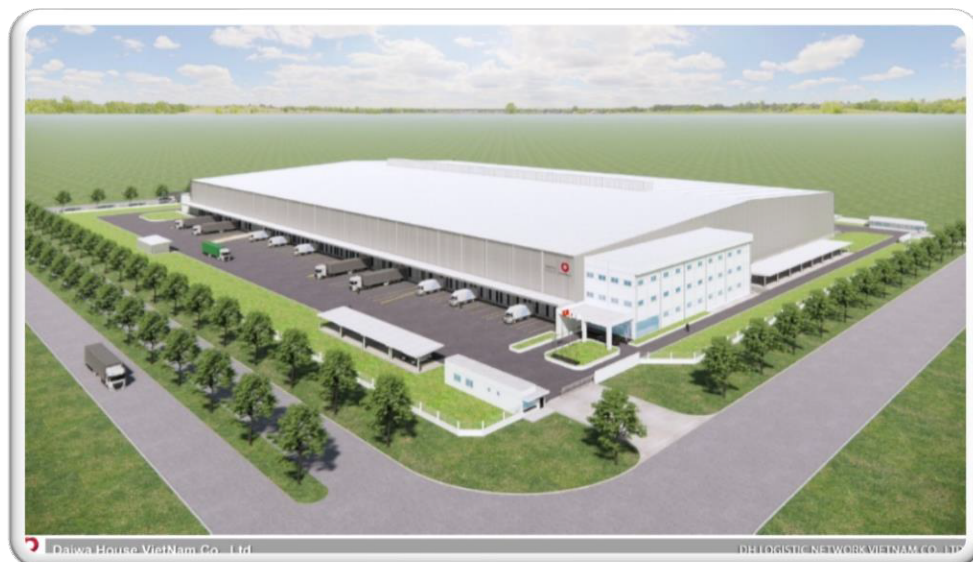
Kho lạnh NEWLAND