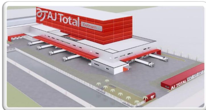
Kho lạnh AJ TOTAL Hưng Yên 42 m