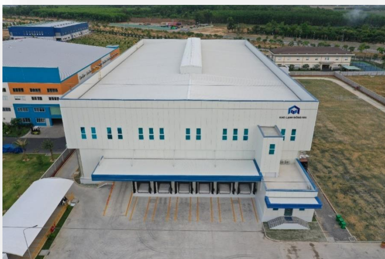
Kho lạnh SAMKU